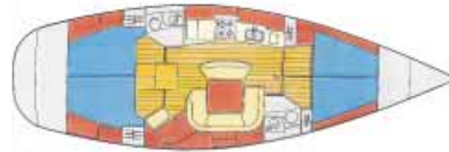
Version 4 cabines / 4 cabin layout