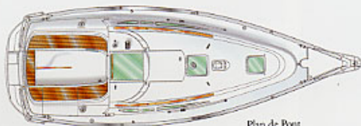
Plan de Pont