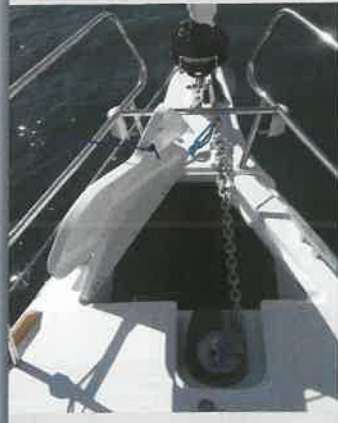
El cofre de anclas, en el extremo de proa, reserva espacio para la instalación del molinete eléctrico opcional.