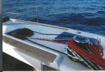
El control de las drizas, la contra, el carro de escota y demás elementos de trimaje se concentra a estribor del roof, donde se sitúa un winche de serie. Sin embargo, puede adquirirse un winche extra.