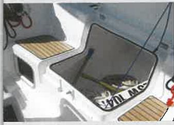
Las bancadas laterales incorporan un cofre amplio y profundo en el que se echa de menos algún tope para la apertura de la tapa.