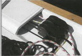
El sistema germano de escota de la mayor y las escotas del génova se regulan desde los winches de la bañera, situados a mano del patrón y dotados de sendos conjuntos de stoppers.