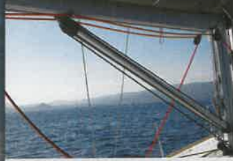
La contra dispone de desarrollo de cabo desmultiplicado para su trimaje y está disponible en versión rígida de forma opcional.

Hacia proa, el diseño limpio de la cubierta facilita la circulación a través de dos pasillos laterales generosos protegidos por el candelero y un calapiés exterior. Descubrimos, así, una proa apta para tomar el sol y el nuevo botalón de proa