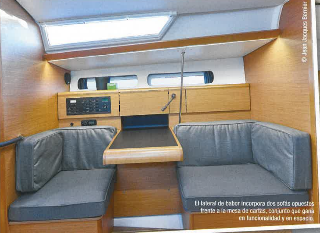
El lateral de babor incorpora dos sofás opuestos frente a la mesa de cartas, conjunto que gana en funcionalidad y en espacio.

La renovación también ha afectado al interior y a su acceso, en el que se ha optado por una escalera de inclinación más suave y por la sustitución de la puerta extraíble por una corredera.